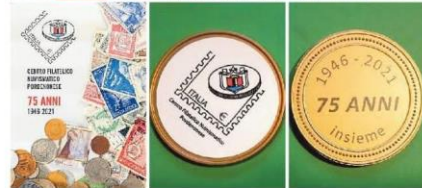
Un incontro dei soci nel 2019 prima della pandemia, la cartolina e la medaglia commemorativa

Il Centro filatelico numismatico pordenonese celebra la ricorrenza Tanti eventi in cantiere: tre mostre per il progetto Dante e Naonistfil