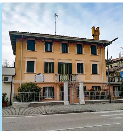
Casa natale di Elia Liut su Viale della Repubblica a Fiume Veneto

In questa casa visse la sua pensosa adolescenza Elia Antonio Liut fu Felice antesignano e maestro del volo valoroso aquilotto della guerra vittoriosa primo audace trasvolatore delle Ande emerito fondatore dell' Aeronautica dell'Equatore lustro e vanto del paese natio morto a Quito. Con memore affettuoso orgoglio i suoi concittadini. Fiume Veneto 6.3.1894 – Quito 9.5.1952