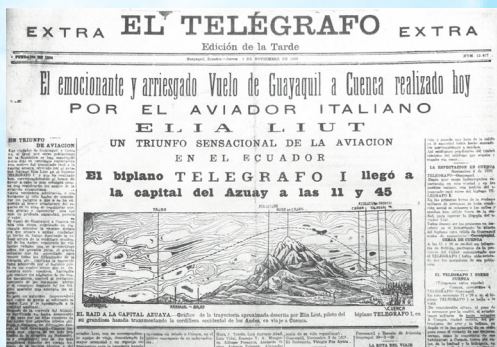
Edizione straordinaria di giovedì 4 novembre 1920 del giornale "El Telégrafo" che annuncia la felice conclusione del raid da Guayaquil a Cuenca