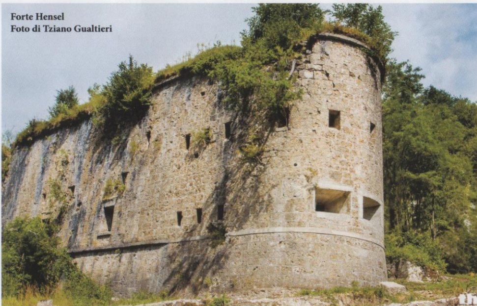
Forte Hensel